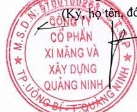
Tô Ngọc Hoàng

Ghi chú: Những chỉ tiêu hoặc nội dung đơn vị không có số liệu hoặc thông tin thì không phải trình bày và không được đánh lại số thứ tự chỉ tiêu và “Mã số”.